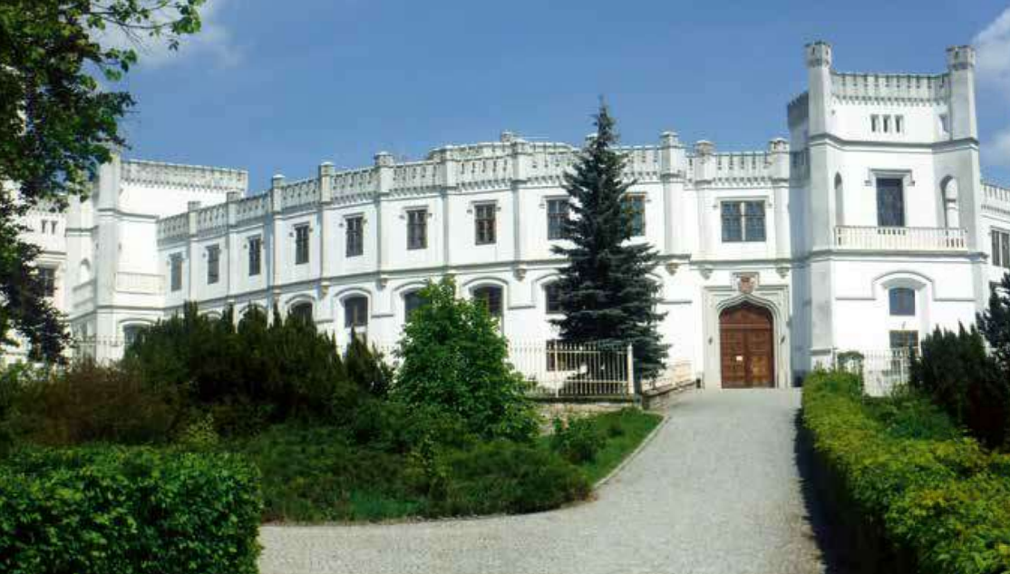
Zámek Nový Světlov