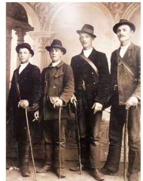
Miškáři z Bojkovic na archivní fotografii