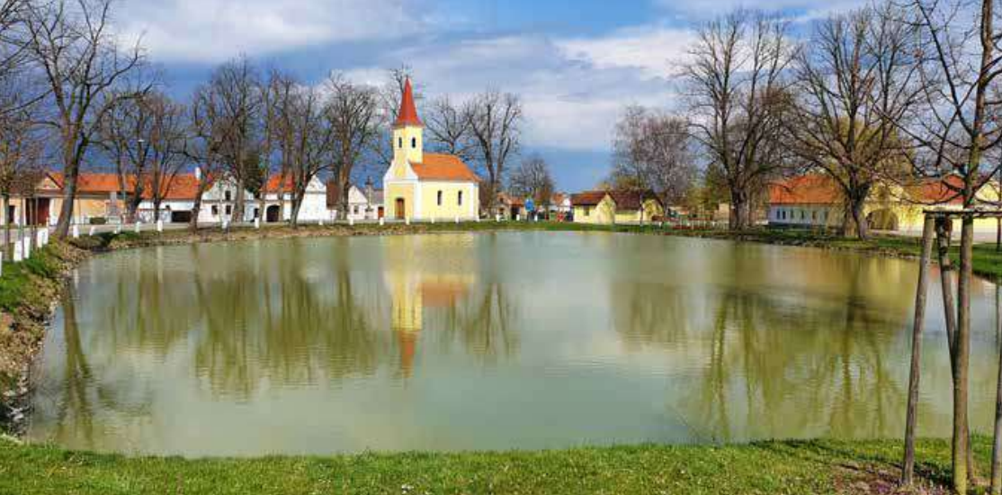
Okrouhlá mažická náves, kde se v rybníku zrcadlí kaplička sv. Anny