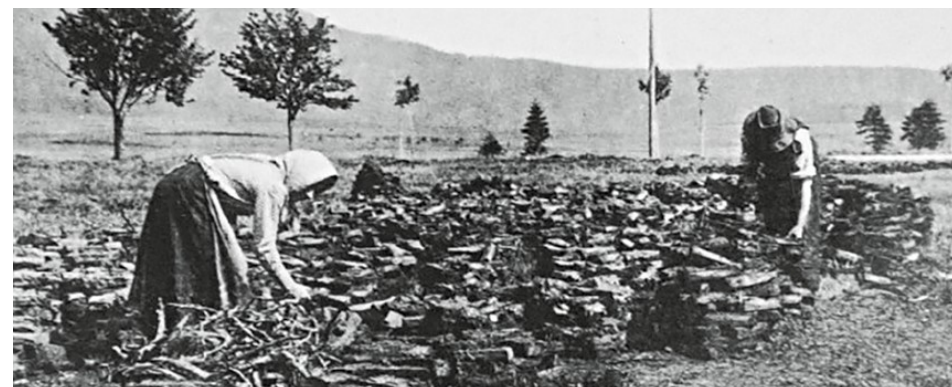
Typický obrázek, jaký byl na blatech k vidění ještě v prvních letech 20. století. Selské ženy skládají na "výkladišti" rašelinné borky do kupek, aby dobře proschly

budována už koncem 13. století, ale dnešní podobu jí dalo až 19. století. Páteřní stoka, do níž jako drobné vlásečnice do tepny směřují z luk a lesů vodní příkopy, odvodnila velkou část Blat. Vede z rybníka Rožberk v nejnižším cípu Černické obory a mezi Komárovem a Zálší se přibližuje k Blatům, která lemuje po jižní straně. V tomto úseku má podobu umělého kanálu, nataženého v krajíně jako rovná, napnutá