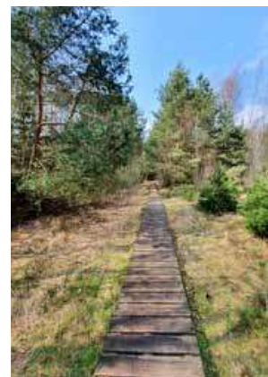
Naučná stezka Borkovická blata nás vede po dřevěných chodnících nad zbytky rašelinišť

ale spíše podle „borků“, jak se říkávalo cihličkám sušené rašeliny. No, a blata, to je snad zřejmé, na takových místech se člověk i po vozy boří a je tam spousta „bláta“. Někdy se těmto rašeliništím říká blata Soběslavská nebo Soběslavsko – Veselská. Je to nejseverněji položené rašeliniště Třeboňské pánve – či spíše nepatrný zbytek jeho někdejší rozlohy. Zdejší rašelinnové ložisko se začalo vytvářet před více než 10 000 lety na zarůstajícím dně pravěké jezerní