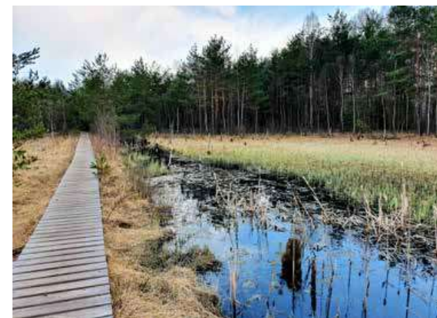
V centru Borkovických blat spatříme odvodňovací kanály i rašelinná jezírka

pánve. Z odumírajících zbytků řas, rákosin, sítin, a především vlhkomilných mechů, které zůstaly uvězněny na dně močálu bez přístupu kyslíku, postupně vznikla vrstva rašeliny o mocnosti od 2 do 6 metrů. Na několika málo místech je tato vrstva dokonce až osmimetrová! Oblast Blat byla dlouho nepříznivá pro trvalé osídlení. Zemědělské plodiny se v zamokřené půdě nedařily, snad jen některé louky na okrajích území se daly využít