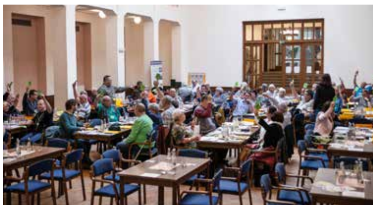
Hlasující účastníci celostátní konference KČT

získal ocenění za túru roku 2021. V průběhu sobotního odpoledne konference projednala zprávy o činnosti Vedení KČT nejen za předchozí rok, nýbrž za celé čtyřleté volební období. Se svou činností delegáty seznámila také Ústřední kontrolní komise KČT, načež bylo projednáno plnění rozpočtu KČT za rok 2021 a návrh rozpočtu na rok 2022. V podvečer pak konference schválila drobné změny Stanov KČT a členské příspěvky na rok 2023 ve stejné výši jako v roce 2022. Došlo i k projednání změny hlasování v Ústředním výboru KČT, která však nebyla přijata, takže hlasování bude probíhat jako doposud. Neděle 27. března byla vyhrazena volbě nového Vedení KČT a nové Ústřední kontrolní komise KČT. Pod