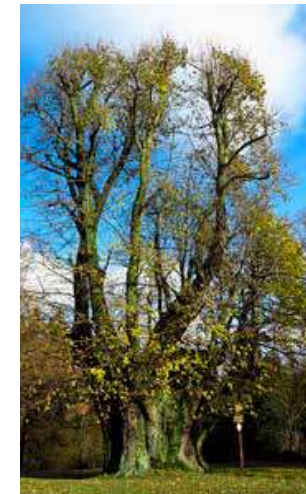
Vejordova lípa je jedním z nejstatnějších stromů v Čechách.

útvár, v němž lidská obrazotvornost viděla čertův trůn či stolec. Na vrcholku stoupání opustíme červené značené (zavedlo by nás do 5 km vzdáleného Žamberka) a pokračovat budeme nad údolím po zelené TZT. Po necelém kilometru naši pozornost nepochybně upoutá majestátní, byť z jara ještě poněkud „strohá“ Vejordova lípa. K tomuto