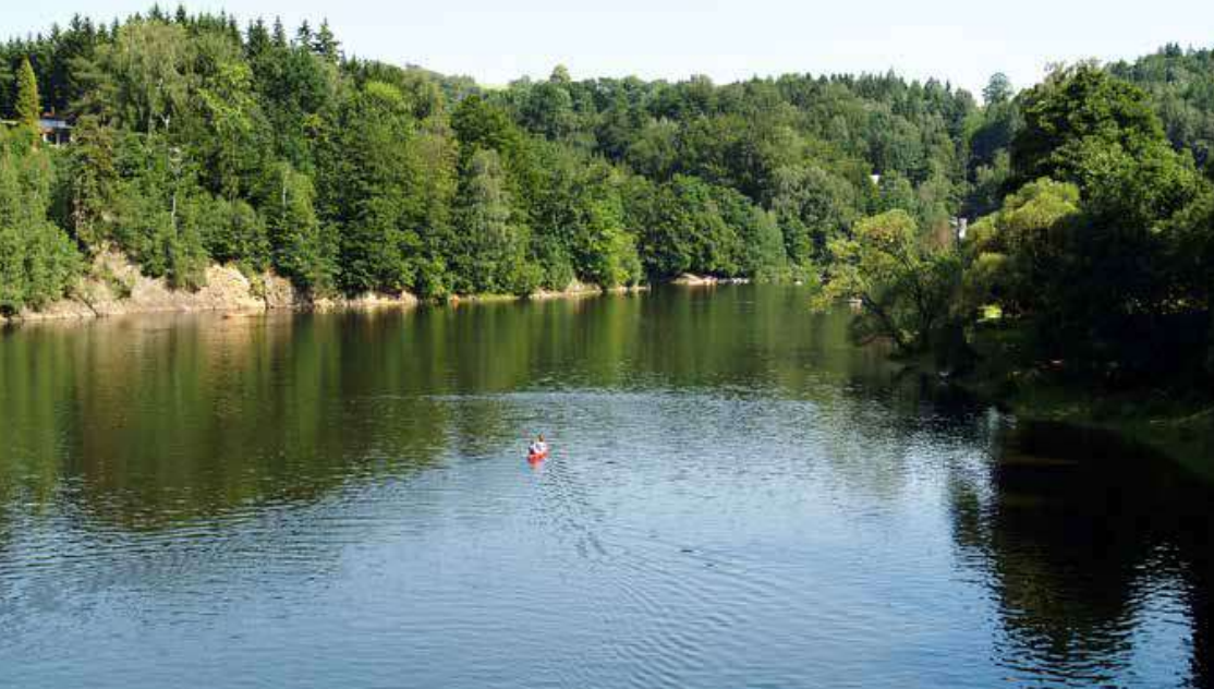
Na jaře je Pastvinská vodní nádrž ještě zcela poklidná.