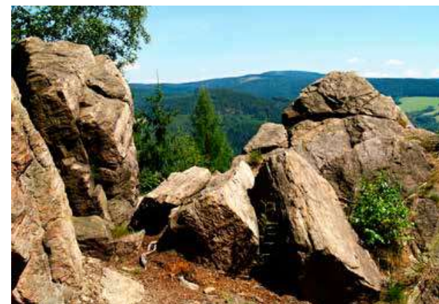
Pohled ze Studenských skal k Suchému vrchu.

památnému stromů, s obvodem kmene 1220 cm jednomu z nejstatnějších v Čechách, i k sousední usedlosti se vztahuje několik zkazek. Ta smutná vypráví o pasáčkovi, který zapadl do dutiny kmenu, kde ho však nikdo nehledal... Poněkud úsměvná je pak „historie“ názvu tohoto místa. Někdejší hospodář prý rád zašel do hospody dole