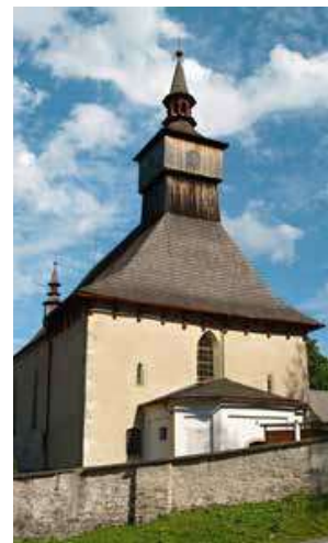
Kostel Nejsvětější Trojice v Klášterci nad Orlicí je kulturní památkou.

Za výchozí místo si můžeme zvolit Klášterec nad Orlicí při horním, tedy ještě zcela „štíhlém“ okraji údolní nádrže. Parkovat se dá uprostřed obce pod gotickým kostelem Nejsvětější Trojice, který je významnou kulturní památkou. Původně byl součástí kláštera,