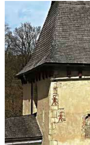
Záhadné malůvky na fasádě klášterec-kého kostela.

Klášteřcem procházejí dvě turisticky značené trasy (TZT). Modré značení nad levým břehem Divoké Orlice nám poslouží při návratu, takže se zprvu se necháme vést červenými značkami. Po široké cestě vystoupíme kolem kostela a rekreačních chat na pravý údolní svah, kde se mezi stromovím občas otevře pohled přes Klášterec na protější návrší Čertovku. Tam se v lese skrývá další místní „čertovinka“ – Čertova skalka, což je nevelký žulový