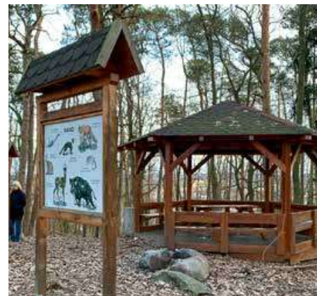
Vrchol Vinice, foto: Jan Kurz